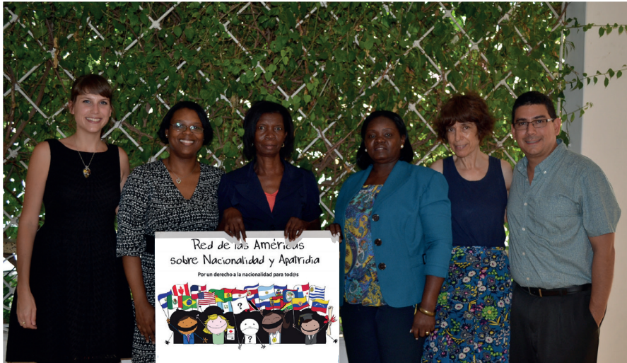
Reunión Estratégica de País de la Red ANA. Santo Domingo, República Dominicana., setiembre de 2015.

Las reuniones estratégicas de país le permiten a la Red ANA consolidar la participación de miembros e identificar las prioridades de trabajo en temas de nacionalidad y apatridia. En septiembre 2015, la Red ANA se reunió con organizaciones locales en República Dominicana para discutir prioridades dentro del país y vías para la colaboración.