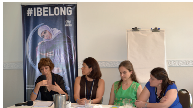
Primera Reunión Regional Anual de la Red ANA. San José. Costa Rica, junio de 2015

Los participantes acordaron que la Red ANA va a facilitar la implementación del Plan de Acción Global y el Plan de Acción de Brasil del ACNUR, sirviendo como una plataforma centralizada con tres objetivos principales: (1) compartir información y mejores prácticas, (2) crear capacidad, y (3) promoción de iniciativas.