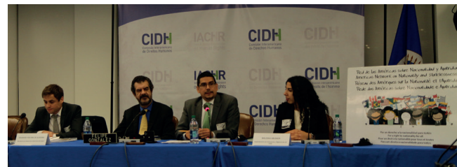
Primera Conferencia Anual de la Red ANA. Washington D:C: EUA, octubre de 2015.

La Red ANA celebró su primera conferencia anual denominada “Nacionalidad y Apátrida en las Américas: Logros y Desafíos” el 22 de octubre del 2015 en la Comisión Interamericana de Derechos Humanos. El evento contó con la participación del Relator sobre los Derechos de los Migrantes de la Comisión Interamericana de Derechos Humanos, representantes del ACNUR, así como de los gobiernos de Chile y Brasil.