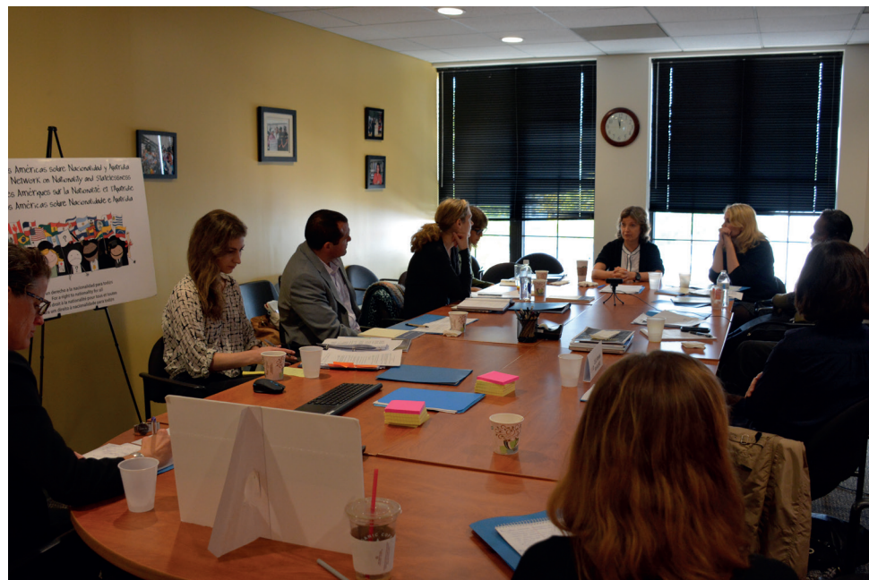
Reunión Estratégica de País de la Red ANA. Washington DC, EUA, octubre de 2015.

En octubre del 2015, la Red ANA sostuvo una reunión estratégica sobre los Estados Unidos en Washington DC, que reunió a miembros de la red de ese país, así como a académicos y expertos externos. La discusión abordó el litigio en torno a la denegación de actas de nacimiento a los hijos de personas indocumentadas en Texas, y la posible contribución de la Red ANA a ese litigio en la forma de un escrito de amicus curiae. Los participantes también tomaron parte de una reunión creativa en relación con una campaña de medios de comunicación en temas de nacionalidad y apatridia en los Estados Unidos.