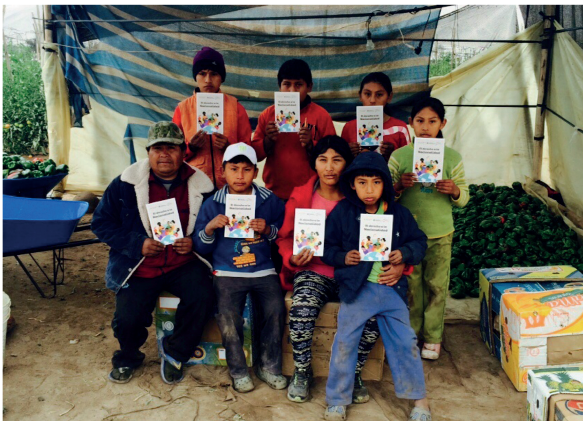
Niñez de los “extranjeros en tránsito” en el norte de Chile. Clínica de Migrantes y Refugiados.

El derecho a la nacionalidad está comprendido en la Declaración Americana de Derechos y Deberes del Hombre de 1948 y en la Convención Americana sobre Derechos Humanos (Pacto de San José) de 1969. Sin embargo, el total de Estados Miembros a la Convención sobre Apatridia de Naciones Unidas es aún bajo. Del total de 35 Estados Americanos, solo 19 de ellos son Parte de la Convención de 1954 y 16 son Parte de la Convención 1961.